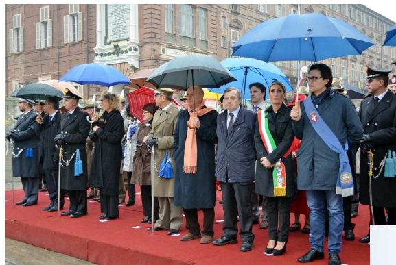
Il palco delle autorità

che non possono mai avallare visioni ingenuie, non realistiche, di perdita di importanza dello strumento militare", sottolineando che "c'è una ricorrente pressione per una riduzione quasi di principio di quell'impegno e dei suoi costi". Successivamente si è svolta una Messa nel Tempio della Gran Madre di Dio con la deposizione di corone presso il Sacratio in omaggio ai Caduti: per tutta la giornata caserme aperte in tutto il Piemonte. Nel tardo pomeriggio in piazza