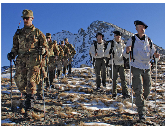
Alpini della Taurinense e Chasseurs Alpins francesi impegnati in un'esercitazione congiunta ad alta quota

hanno offerto nell'adempimento nei diversi teatri operativi all'estero. Altresì, per la devozione e l'impegno incondizionato profusi