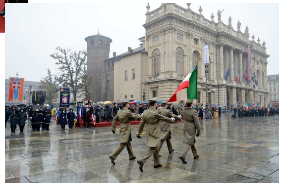
Un momento della cerimonia

gressivamente le società anche grazie alla perversa forza attrattiva. Questa è una minaccia reale, anche militare. Penso - ha proseguito il Presidente nel suo messaggio - che da parte di ogni paese Nato si debba esser seri nel prendere decisioni,