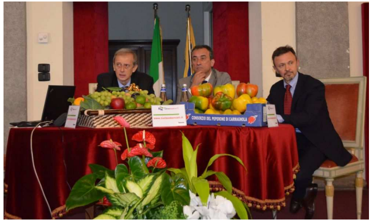
Sopra: la conferenza stampa di oggi. Sotto: l'homepage del nuovo portale

Un sito "in divenire" che oggi apre con i primi 60 banchi ma entro fine ottobre il numero salirà a 100, dopodiché lo sviluppo dipenderà anche dalla volontà degli ambulanti di "prendere in mano" la propria area e svilupparla in modo sempre più indipendente, evidenziando i propri punti forti per attrarre nuovi clienti.