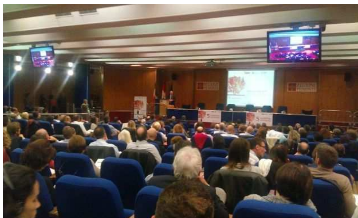
Il Ministro dell'Ambiente, Gian Luca Galletti, durante l'intervento al convegno

È stato il Ministro dell'Ambiente, Gian Luca Galletti ad aprire i lavori del 5° Workshop su "Sviluppo e sostenibilità ambientale: prospettive tecniche e normative nel confronto Italia-Europa" che si è tenuto oggi al Centro incontri della Regione in corso Stati Uniti. Nel meeting, organizzato da Confindustria Piemonte, Regione Piemonte, Provincia di Torino e EDF Fenice, nell'ambito della rete europea Enterprise Europe Network, sono state affrontate le strategie e le opportunità di una corretta sostenibilità ambientale in un'ottica di sviluppo economico e occupazionale. Il Workshop è stato infatti basato sull'analisi e sul supporto della gestione dell'ambiente come occasione di sviluppo in armonia con i nuovi regolatori ambientali dell'Unione Europea. In particolare sono stati approfonditi i concetti legati al recepimento della Direttiva sulle Emissioni industriali (IED). L'incontro, a cui hanno partecipato