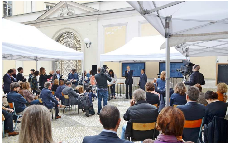
Un momento della conferenza stampa

I MagazziniOZ contengono spazi per corsi ed incontri, stanze in cui imparare, studiare, pareti piene di libri, oggetti da comprar, si apriranno a persone che parleranno di argomenti quali il parlare in pubblico, la cucina, la finanza, il digital divide ed altri ancora, mettono in vendita manufatti di coo-